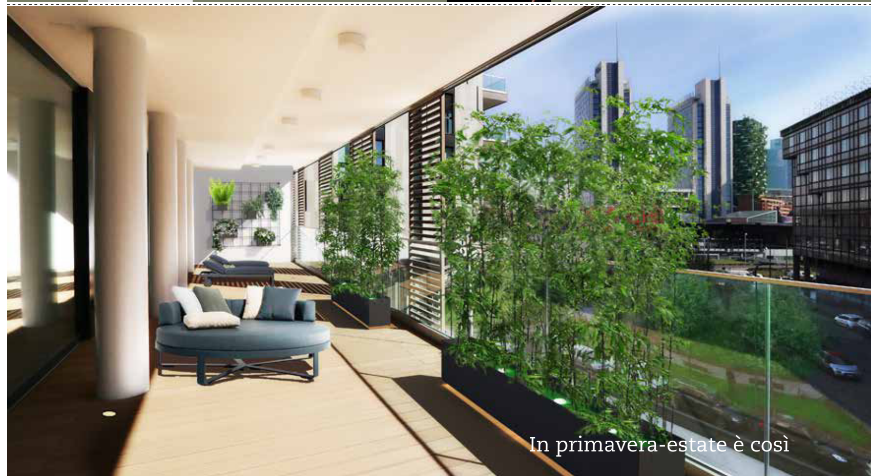
In primavera-estate è così

La lampada. Da inserire nei vasi, I-snap, di Antonangeli Illuminazione, è una lampada in plex a Led bianco caldo, blu o ambrato, montata su un'asta in rame direzionabile. La versione lunga 60 cm costa 178 €, il trasformatore, necessario per alimentare fino a due lampade, costa 56 €.